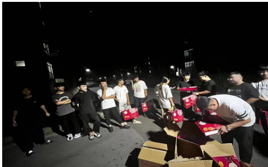
图 3.7.3 学校教师赴学生实习地看望学生 1