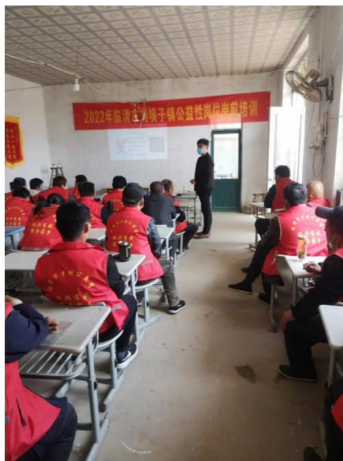
图 5.2 转岗培训照片 2 1