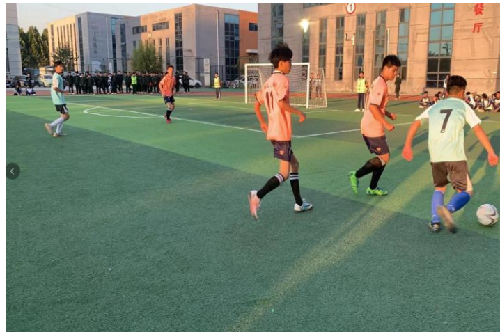
图 2.2.2 2022 年校园足球比赛 1