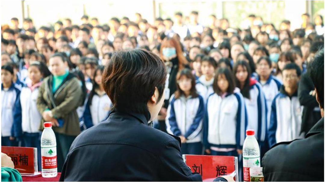
图 2.3.2 感恩报告会 1