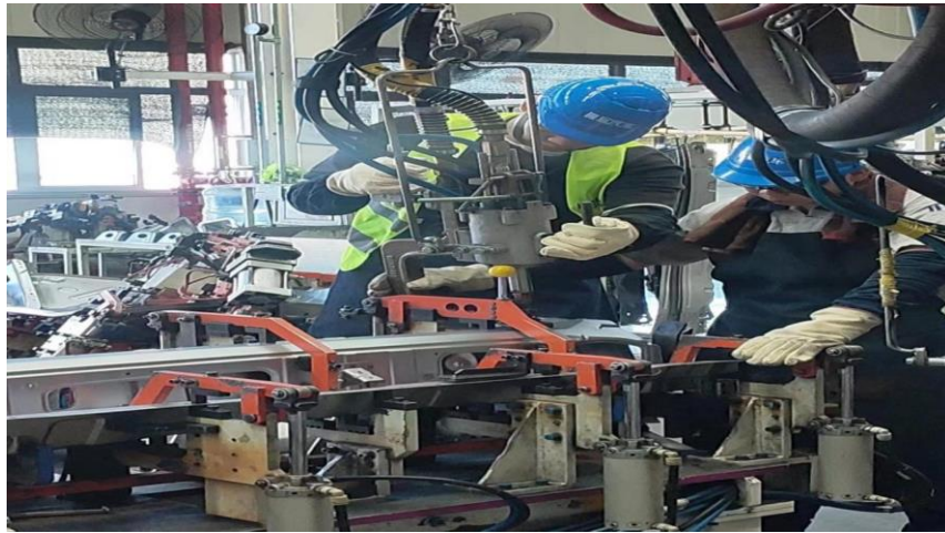
图 3.7.2 新能源学生在实习现场 1