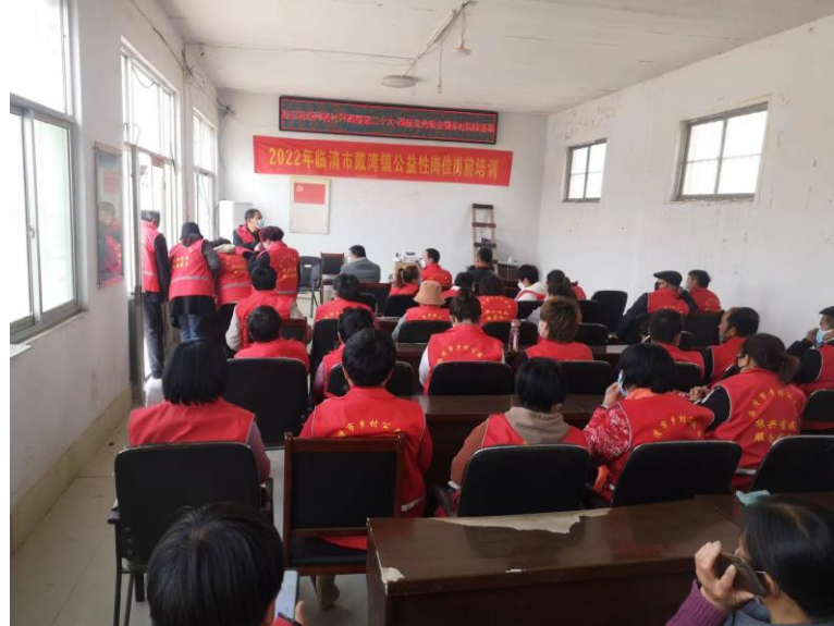
图 5.2 转岗培训照片 1 1

领 20 余名具有专业培训经验的教职工前身临清各乡镇、村庄对各村镇的剩余劳动力进行了转岗培训，培训内容涉及安全知识、职业素养等通用知识，电工、保育、烹饪等专业知识。