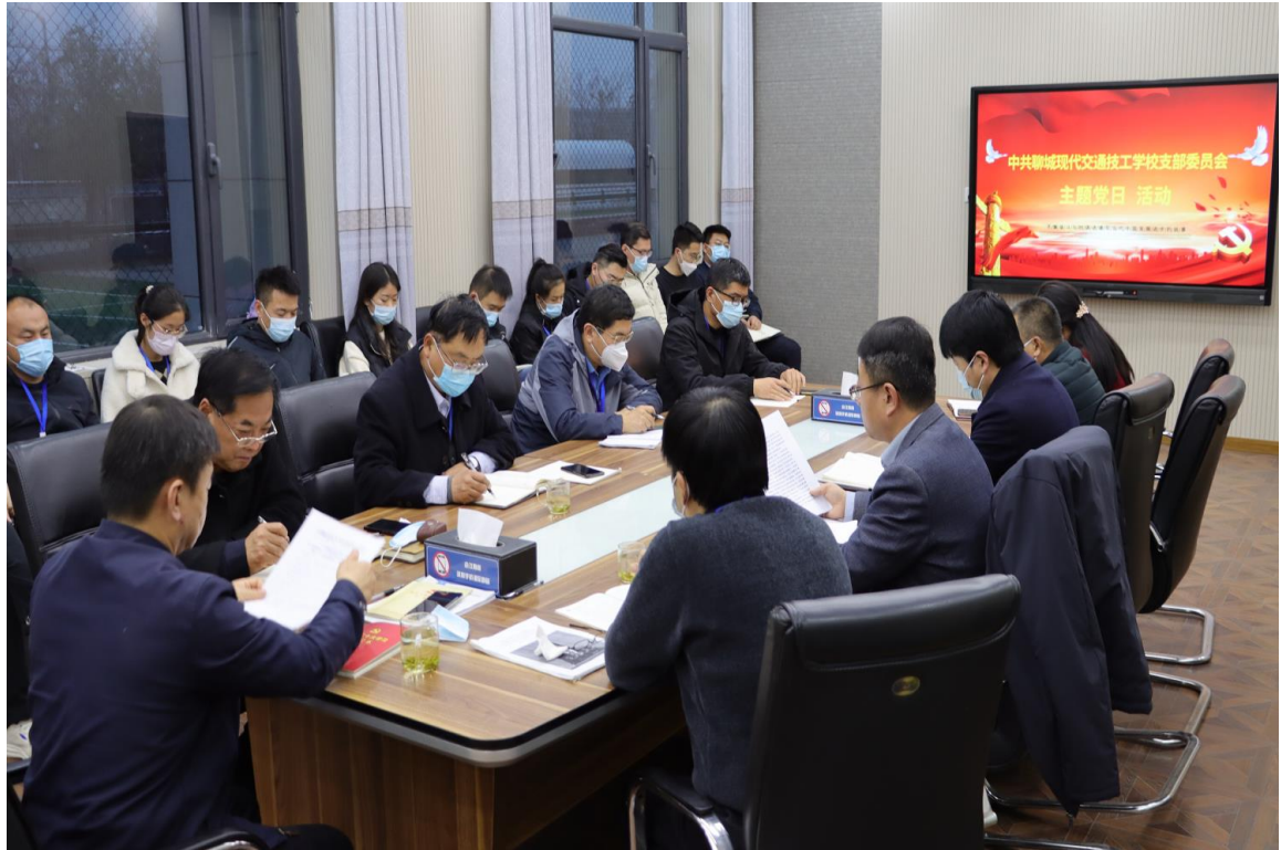
图 2.1.1 主题党日活动 1