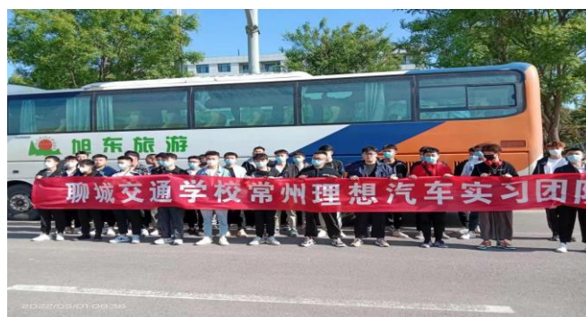
图 3.7.1 新能源专业学生赴常州理想汽车实习 1

加强用人单位与实习生、学生家长的沟通，要求班主任每月不定期的对校外实习学生联系两次以上，保持学生与家长、班主任的信息畅通。了解实习学生在企业的工作、学习、生活、安全管理等情况，及时进行信息反馈，出现问题及时解决。