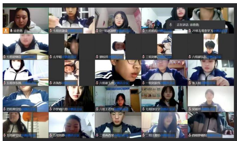
图 3.3.1 同学们正在上网课 1

在线课程资源的建设和线上活动的开展是线下课程很好的辅助，打通课前课中课后环节，使师生沟通多一条渠道，高效利用数据辅助分析学生行为，更便捷地评价和反思教学。同时在疫情发生发展的特殊时期，使教学不中断。通过智慧职教云平台、微信、QQ、腾讯会议等混合式教学模式实现线上布置学习任务、讨论任务、开展教学、考核评价。