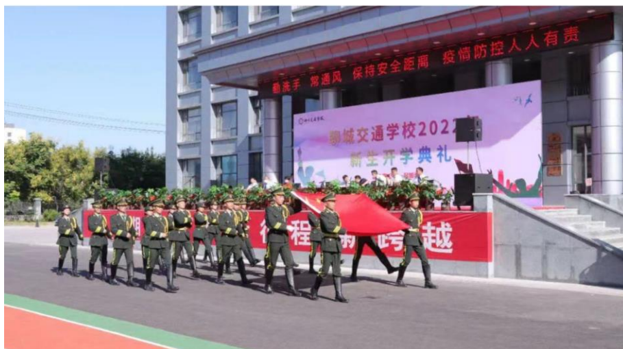
图 2.2.3 2022 级新生军训动员大会 1