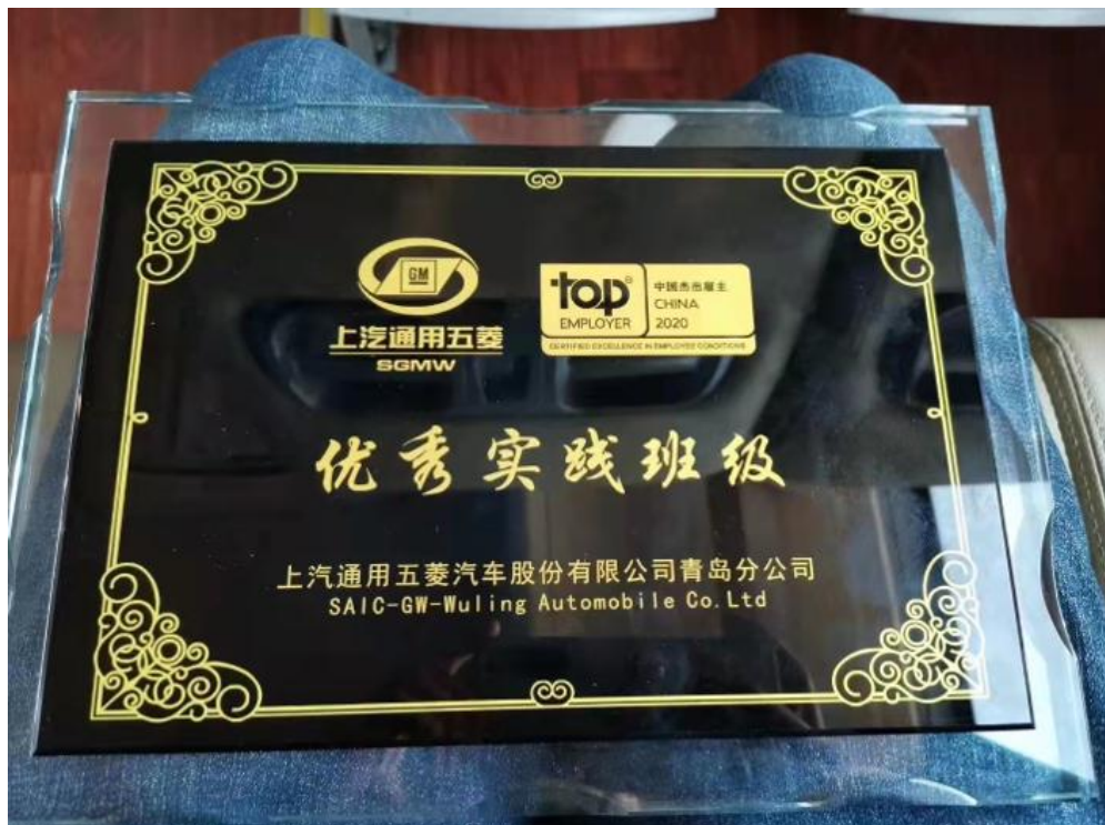
图 2.4.1 学生在企业获奖证书 1

学校针对就业班开设就业指导必修课。学校认真贯彻落实教育部有关文件精神，把“职业指导课”、创业培训纳入学校教学计划，建立了以职业生涯规划、创业教育、就业指导三大内容为主的理论与实践紧密结合的就业创业指导课程体系。学校建有职业指导与心理健康实训室，负责职业指导课教学工作，努力转变学生就业观念、提高学生就业技能。目前已形成一年级进行“职业生涯规划”教育、二年级进行“就业形势、政策和技巧”教育，三年级组织不同规模、形式的就业讲座的就业指导体系。同时，加大对就业困难毕业生的就业指导力度，通过重点指导、优先推荐，实施“一对一”的就业服务，提升毕业生就业竞争力，帮助顺利就业。