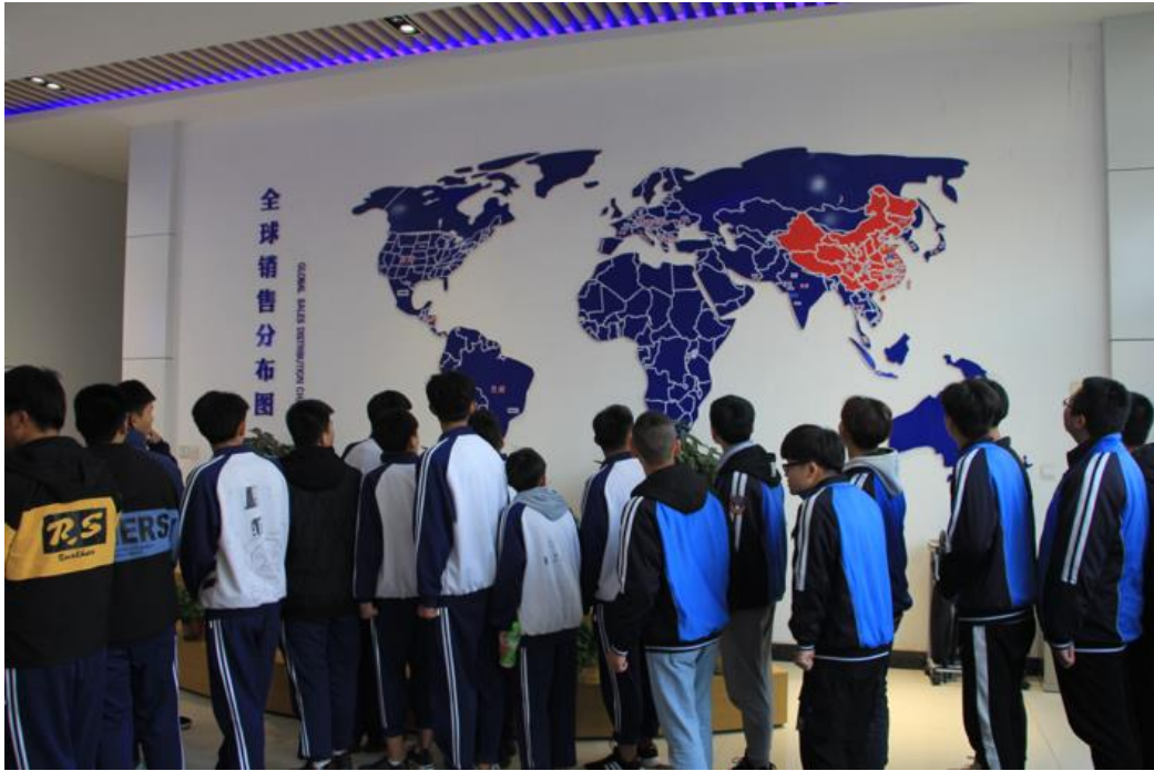
图 2.4.2 学生就业前参观企业1