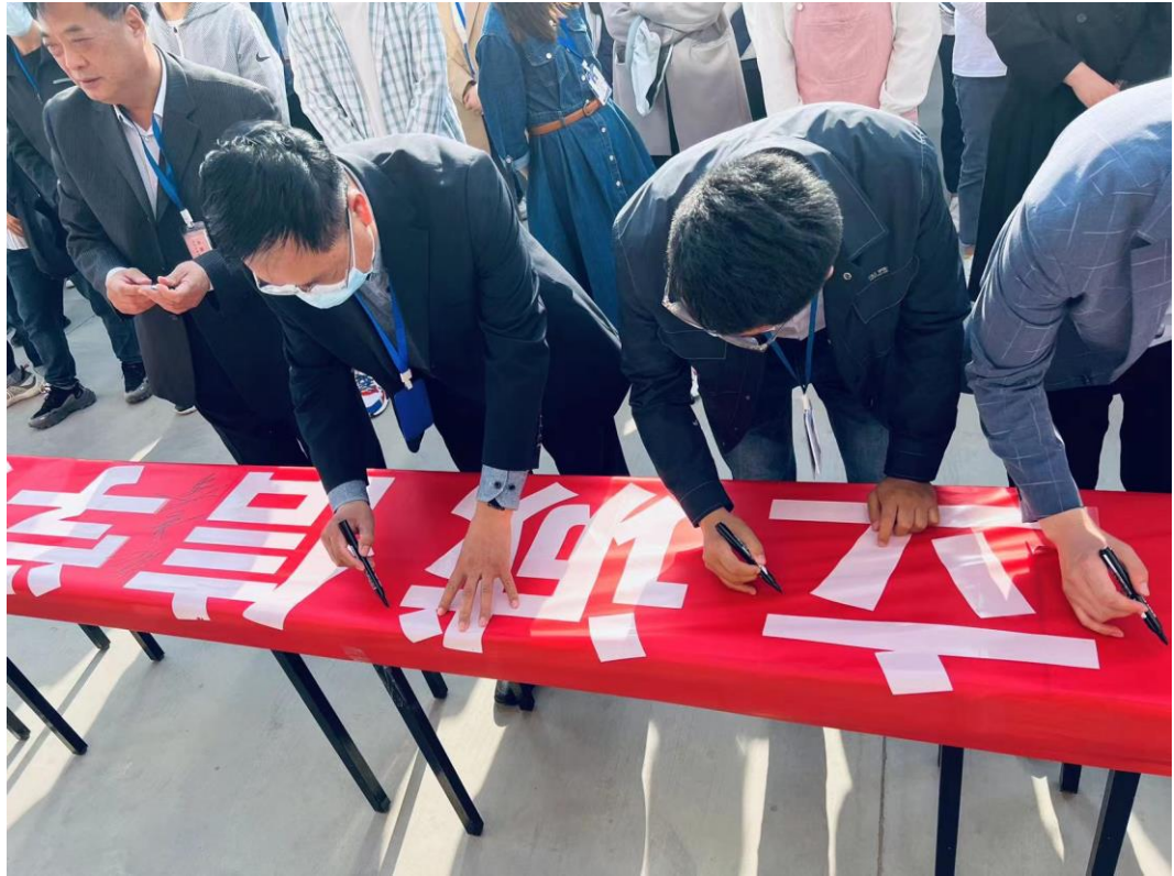
图 2.3.4 诚信活动签字现场 1