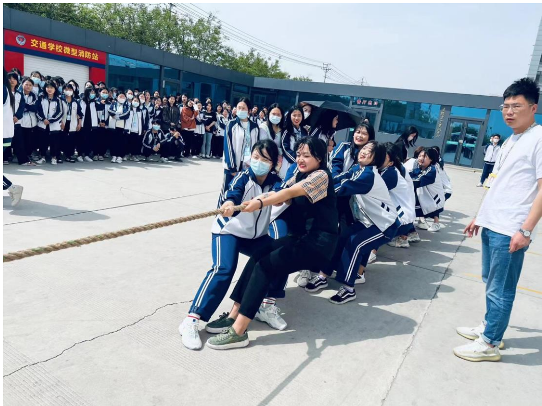
图 2.3.3 挑战极限拔河比赛 1