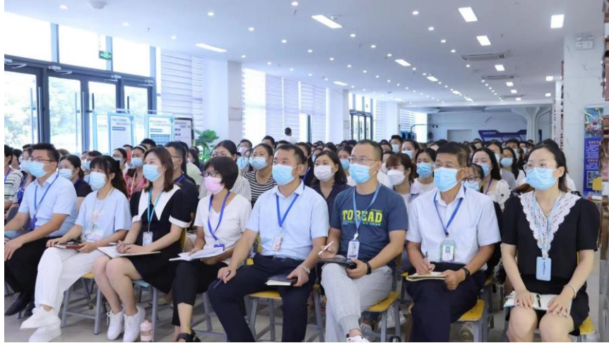
图 3.6.1 教师能力提升现场 1

提升创新教学创新团队能力。针对已组建的教学创新团队，加强对教师创业能力、信息化水平的培训和指导，实施分工协作、模块化教学模式的改革，提高团队教育教学整体水平。