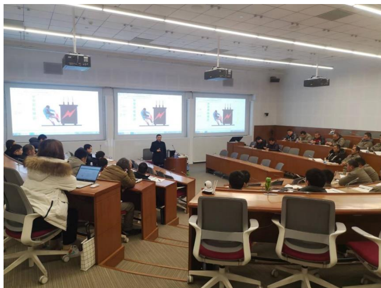
图 5.1 吴老师在企业现场培训 1

学校建立激励机制，引导教师密切联系企业，鼓励教师利用专业优势展开社会职业培训，一大批“双师型”教师迅速成长。2021-2022 学年学校组织主要培训内容包含市场营销、创新创业、就业指导和电子商务等方面，教师培训效果良好，实用性强，受到培训对象的一致性好评。