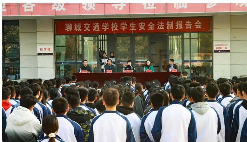
图 2.3.1 法制报告会 1