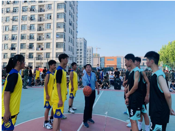
图 2.2.1 2022 年校园篮球对抗赛 1