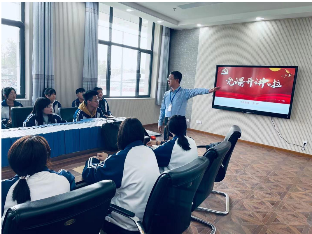
图 2.3.5 永远跟党走宣传现场 1